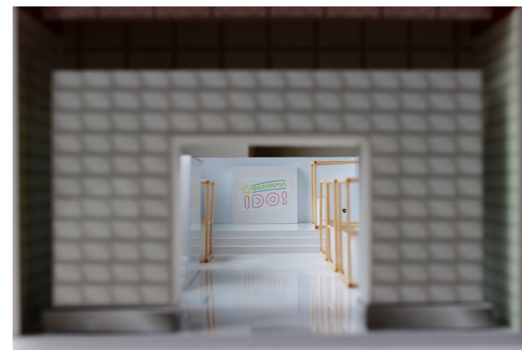
<店舗イメージの模型写真>